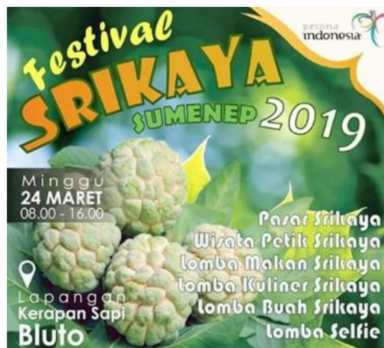
Gambar 1. Media Publikasi (Poster) Festival Buah Srikaya yang Disebarkan Melalui Sosial Media

Kondisi Pasar Buah Srikaya. Sebagai salah satu potensi daerah Kabupaten Sumenep, kondisi pasar buah srikaya dapat dikatakan potensial. Hal tersebut juga yang kemudian menjadi inspirasi bagi para pegiat wisata yang tergabung dalam ‘Jung Rojung’ WAG Forum Pariwisata Sumenep terinspirasi mengadakan Festival Srikaya untuk menarik pengunjung wisata datang ke Sumenep dan mempromosikan buah srikaya khas Sumenep sebagai sarana memperluas pasar buah srikaya.